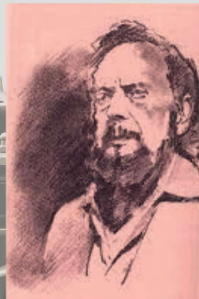
(Σκίτσα του Κώστα Ράμμου)